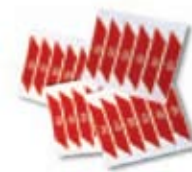
WA10 Fényvisszaverő matricák