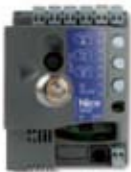
XBA2 Vezérlő egység az X-Bar-hoz.