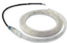
XBA4 Led lámpasor a sorompókarhoz, alsó vagy felső elhelyezésre.