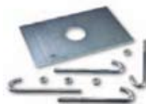
SIA1 Alaplap, rögzítő csavarokkal