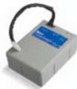
PS124 Akkumulátor beépített töltővel